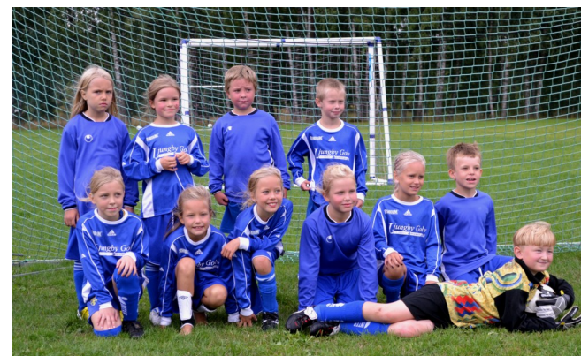
Samtliga lägerdeltagare samlade efter cupen.