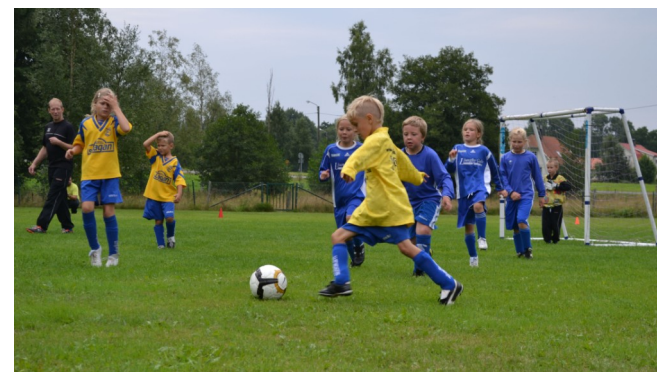
Bolmsö i blått möter ett av lagen från Lagan.