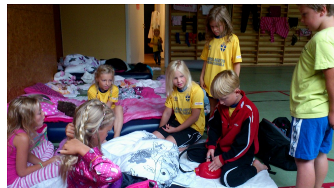
Barnen i Bolmsö IF övernattade i gymnastiksalen.